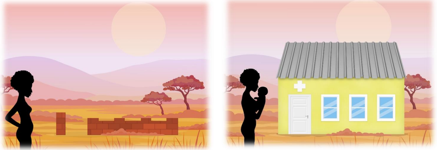
Foto van animatie op de website. Een visualisatie van de projectvordering.

In de nieuwsbrief van mei vermeldden we dat 'Fase 4', de bouw van de materniteit, door ongeziene aanhoudende regenval, die heel Oost-Afrika trof, enkele maanden vertraging opliep. De wegen en waterleidingen werden vernield en inmiddels hersteld. Doordat vrachtwagens zich continu vastredde in de modder betaalden we hogere transportkosten. De grote infrastructuurwerken werden om die reden stilgelegd en enkel de incinerator (kleine verbrandingsoven) werd afgewerkt. De vroegere, gevaarlijke, 'waste-pit' nabij de lagere school, een met acaciatakken omheind gat in de grond waar al het medisch afval verbrand werd, is nu voorgoed verleden tijd.